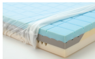
※写真は全て CORE Mattress12