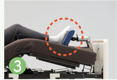
ポジショニングサポート 笑(エミ)フットレスト

肩や腕の重さを緩和することで自ら食べやすくなり、利用者自身が食べる喜びを得られます。