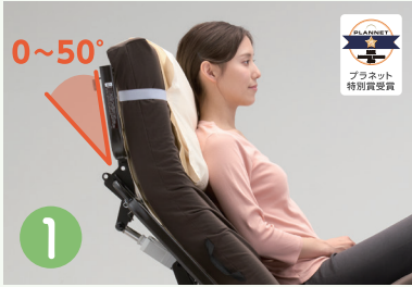
在宅介護向けベッド Emi(エミ)